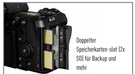
Doppelter Speicherkarten-slot (2x SD) für Backup und mehr