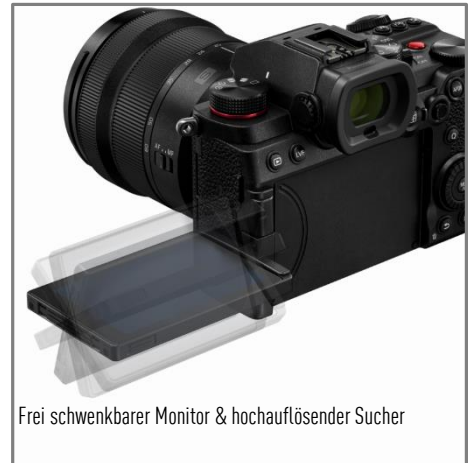
Frei schwenkbarer Monitor & hochauflösender Sucher

Die LUMIX S5 verbindet Foto und Video in Perfektion. Zusammen mit dem neuen Autofokus, dem robusten Magnesiumgehäuse und nicht zuletzt der Kompaktheit macht sie das zum idealen Begleiter für Fotografen und Videografen, die keine Kompromisse wollen.