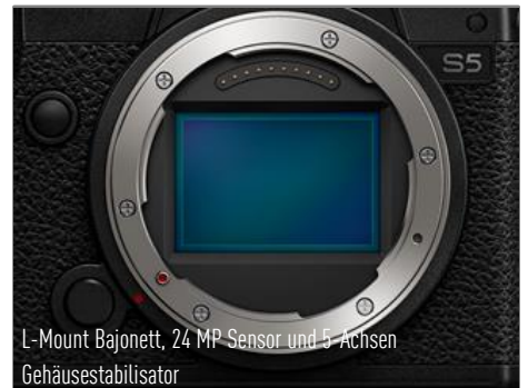
L-Mount Bajonett, 24 MP Sensor und 5-Achsen Gehäusestabilisator

DC-S5KE-K I 5025232940080 (S5 Body + R2060) | UVP Deutschland 2.241,04 € inkl. 16% MwSt., UVP Österreich 2.299 € inkl. 20% MwSt.