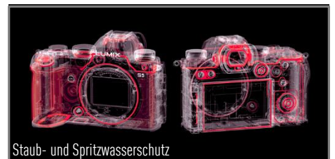
Staub- und Spritzwasserschutz